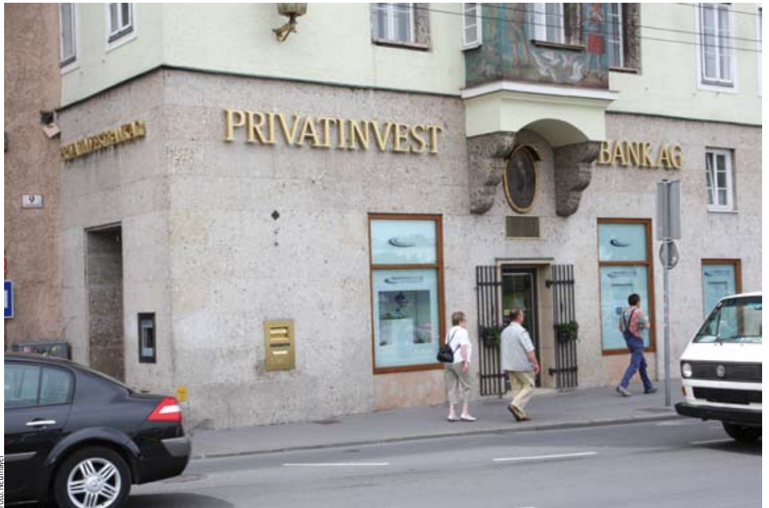
WANN HAFTET eine Bank für Bestätigungen?