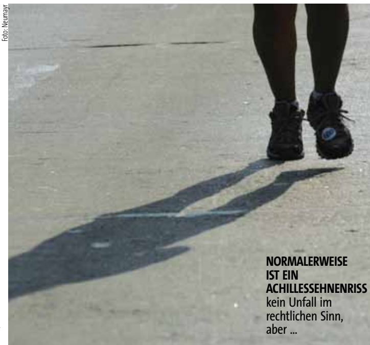
NORMALERWEISE IST EIN ACHILLESSEHNENRISS kein Unfall im rechtlichen Sinn, aber ...