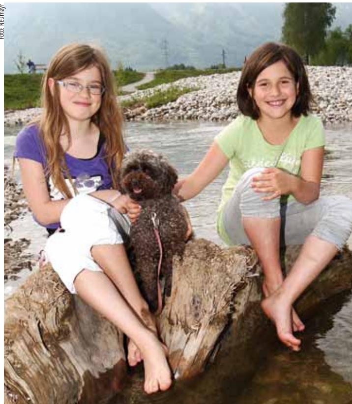
DER GESETZGEBER schützt die Tierliebe.

Es zeigt sich, dass zu Rettung von Tieren durchaus auch größere Beträge aufgewendet werden, eine fixe Wertgrenze lässt sich aus diesem Urteil jedoch nicht herauslesen. Es liegt im Ermessen des erkennenden Richters, welcher Betrag noch als angemessen angesehen wird. Sowohl der Wert des Tieres als auch die Stärke der Affektion zum Tier müssen in Korrelation zu den aufgewendeten Kosten stehen. ■