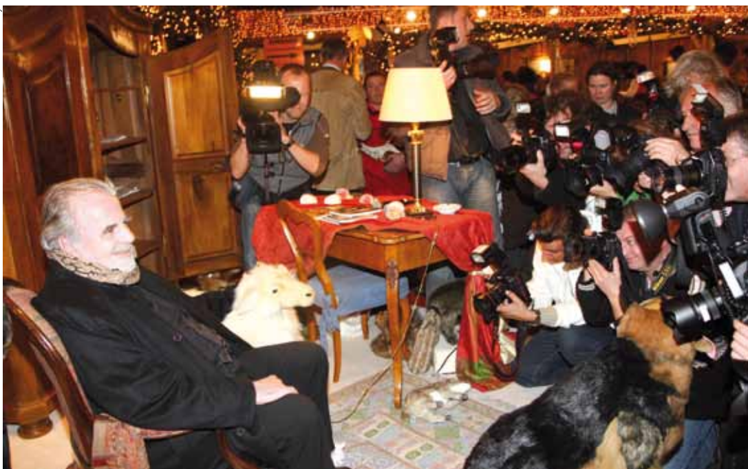
AUCH PRIVATE KNIPSER können zu Paparazzi werden.