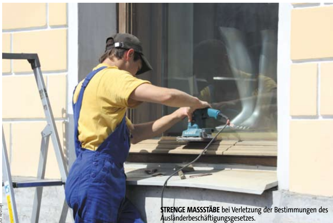
STRENGE MASSSTÄBE bei Verletzung der Bestimmungen des Ausländerbeschäftigungsgesetzes.

Dreimalige Verletzung • des Ausländerbeschäftigungsgesetzes