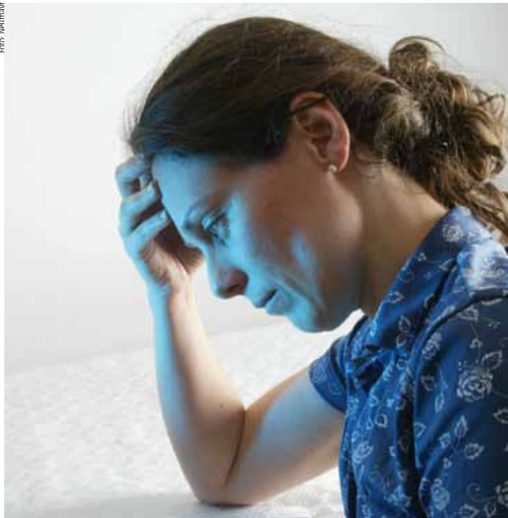
MOBBING UNTER ARBEITNEHMERN: Jetzt ist der Arbeitgeber gefragt.

Die Schäden wurden dem Arbeitnehmer nicht vom Arbeitgeber selbst, sondern von anderen Arbeitnehmern zugefügt. Sie sind aber laut OGH dem Arbeitgeber zurechenbar, weil er seine Fürsorgepflicht verletzt hat. Die allge-