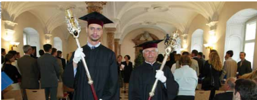
WENN SICH DER STUDIENERFOLG VERZÖGERT, sind nicht immer die Studierenden selbst schuld.